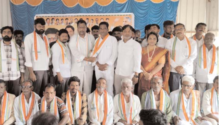
పేదవాడికి అందగా ఉంటుందని, ధర్మాపురి నియోజకవర్గ అభివృద్ధికి తన వంతు