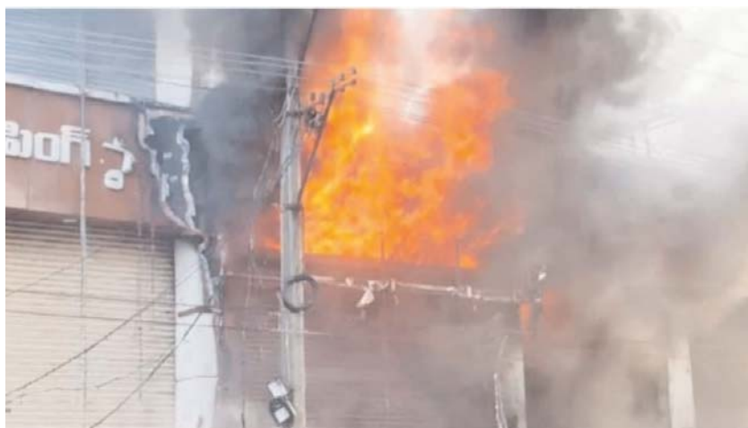
జనగామ అక్టోబర్ 27 (ప్రజామంటలు) :

జనగామ జిల్లా కేంద్రంలోని విజయ షాపింగ్ మాల్ లో భారీ అగ్ని ప్రమాదం చోటుచేసుకుంది. ఆదివారం ఉదయం బస్ స్టాండ్ రోడ్ లోని విజయ షాపింగ్ మాల్లో ఎగిసిన దుస్తుల మంటలను చూసి స్థానికులు అగ్నిమాపక సిబ్బందికి, పోలీసులకు సమాచారం అందించారు. దీంతో రంగంలోకి దిగిన అగ్నిమాపక సిబ్బంది మంటలను ఆర్పేందుకు ప్రయత్నిస్తున్నారు. బట్టల షాప్ కావడంతో మంటలు శరవేగంగా వ్యాపిస్తున్నాయి. పోలీసులు ఘటనా స్థలానికి చేరుకుని పరిస్థితిని సమీక్షిస్తున్నారు. మంటలు అదుపులోకి వచ్చిన తరువాత అగ్ని నష్టం, ప్రమాదం ఎలా జరిగిందనే వివరాలు తెలిసే అవకాశం ఉంది. జిల్లా కేంద్రంలో ప్రముఖ వస్త్ర దుకాణం కావడంతో అగ్ని నష్టం భారీగా వుంటుందని భావిస్తున్నారు.