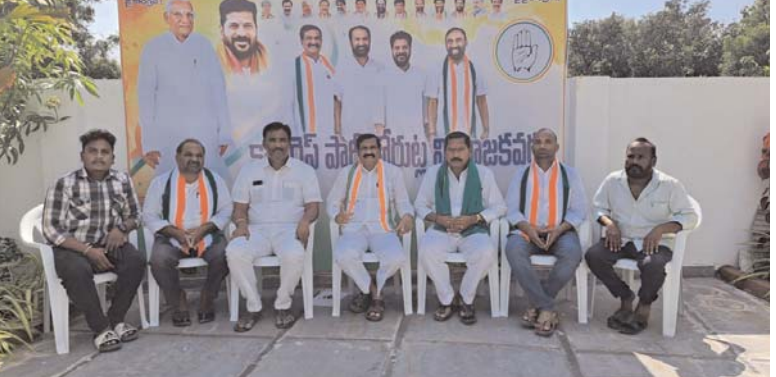
కోరుట్ల అక్టోబర్ 26 (ప్రజా మంటలు) :