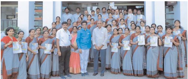
జమ్మికుంట అక్టోబర్ 26 (ప్రజా మంటలు) :