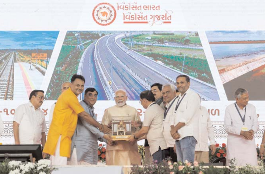
భారత్తో కలిసి అభివృద్ధిపథంలో నడిచేందుకు ట్రిప్ దేశాలు చొరవ చూపుతున్నారన్నారు. గుజరాత్లోని అమ్రేలి జిల్లాలో ఏర్పాటు చేసిన ఓ కార్యక్రమంలో పాల్గొని మగతా 2లో..

వడోదర (ప్రజా మంటలు): యావత్ ప్రపంచం భారత్ వైపు ఆసక్తిగా చూస్తోందని, భారత్ మాటలను ప్రపంచ దేశాలు అత్యంత శ్రద్ధతో వింటున్నాయని ప్రధాని మోడీ పేర్కొన్నారు. మన దేశం వివిధ రంగాల్లో కల్పిస్తున్న అవకాశాల గురించి విస్తృతంగా చర్చించుకుంటున్నారన్నారు. సి-295 తయారీ కేంద్రంతో మేకిన్ ఇండియా నినాదం బలోపేతం వారా 2లో..