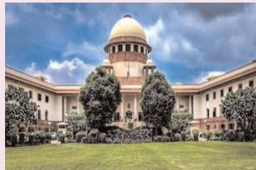
బాల్య వివాహాల నిరోధక చట్టాన్ని సమర్థవంతంగా అమలుచేయాలి

సంగీల్ బెంట్ తీర్పును సమర్పించిన డివిజన్ బెంట్ ఈనెల 21 నుంచి 27వ తేదీ వరకు పరీక్షలు యథాతథం 46 కేంద్రాల్లో మెయిన్స్ పరీక్షలు హాజరుకానున్న 33,383 మంది అభ్యర్థులు