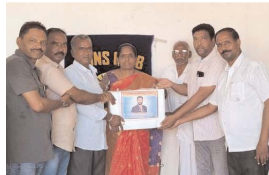
లయన్స్ క్లబ్ ఆఫ్ గొల్లపల్లి ఆధ్వర్యంలో