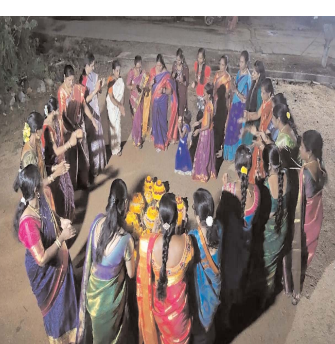
జనగామ పట్టణంలోని 27వ వార్డు రెడ్డి వీధిలో ఎంగిలి పూల బతుకమ్మ ఆడుతున్న దృశ్యం