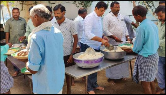
మల్లాపూర్ సెప్టెంబర్ 12 (ప్రజా మంటలు): మల్లాపూర్ మండల్ మొగిలిపేట గ్రామంలో గణపతి నవరాత్రుల సందర్భంగా ఆదర్శయూత్ ఆధ్వర్యంలో ఏర్పాటు చేసిన అన్నదాన కార్యక్రమాన్ని కొద్దికాయ కొద్ది ప్రారంభించిన డిప్యూటీ సీనియర్ కల్యాణం కమిటీ సభ్యులు. పాత దారాజ్ పల్లి గ్రామం ఎస్పీ కాలనీ లో వైఎంఎన్ యూత్ ఆధ్వర్యంలో గణపతి నవరాత్రుల సందర్భంగా ఏర్పాటు చేసిన అన్నదాన కార్యక్రమానికి హాజరైన కల్యాణం కమిటీ రావు.