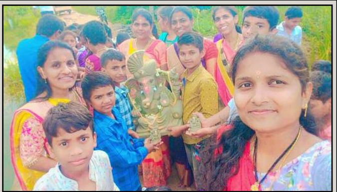
మల్లాపూర్ మండల మెగిపేట గ్రామంలో శ్రీ చైతన్య పబ్లిక్ స్కూల్లో నిలిపిన వినాయకుని నిమజ్జం ఘనంగా జరుపుకున్నారు. ఈ కార్యక్రమంలో కరస్పాండెంట్ శ్రీధర్, ఉపాధ్యాయులు విద్యార్థులు పాల్గొన్నారు.