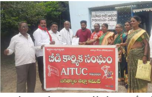
అవేదనవ్యక్తం చేశారు అటు సమైక్య చేసి గోదాన్లుపై తనిఖీలు చేసి వాని రకని తునీకాకును సీల్ చేయాలన్నారు ప్రస్తుతం కంపెనీలో నిలువ ఉన్న తునీకాకును కట్టింది కటింగ్ చేసి యావరేజ్ పెంచాలని దేశంపై బీడి కంపెనీ నుండి తయారుచేసిన వివిధ రకాల బిక్స్

కోరుట్ల సెప్టెంబర్ 12 (ప్రజా మంటలు): బీడి యజమాన్లులు కార్మికుల శ్రమ దోపిడీని అరికట్టాలి ప్రభుత్వ కార్మిక శాఖ అధికారులకు బీడి కార్మిక సంఘం ఫిర్యాదు చేశారు. దేశంపై బీడి బ్రందర్స్ లిమిటెడ్ బీడి ప్యాకర్ల కోరుట్ల రేంజ్ పరిధిలో కోరుట్ల రాయకల్ మన్నగూడెం తాండీయాల మెడికల్ సెంటర్ ముఖ్య కేంద్రాలు ఉన్నాయని, వివిధ గ్రామాలలో 300 బ్రాండ్లలో 12 వేల మంది నిరక్షరాస్యులు అయిన మహిళా బీడి కార్మికులు పీడిని చుట్టూటూ కుటుంబం పోషణ గడుపుతున్నారని పేర్కొన్నారు. వీరి సెంటర్ పరిధిలోని గోదాన్లు నుండి నరసరావు చేస్తున్న వాని రకమైన దొర్ల నలుపు గజ్జర వలుగు ముక్కుడు తదితర రకాలుగా పోలి ఉండటం వలన వేయి బీడిలకు సరిపడా తునీకి అటు తాకం చేస్తే 500 బీడిలకు సరిపాటుపం పల్ల మిగతా 500 తొలికొ కొనుగోలు చేసి భర్తీ నివేదం మూలంగా అసలు కూలి డబ్బులు నష్టపోతున్నారని