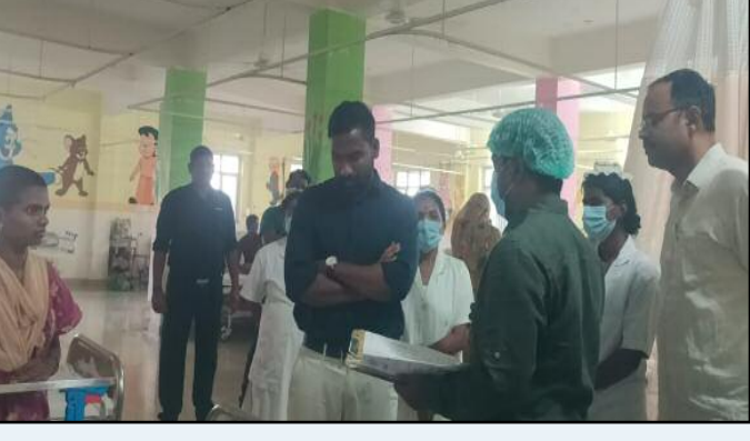
జగిత్యాల సెప్టెంబర్ 12 (ప్రజామంటలు): రోగులకు అందుతున్న వైద్య సేవలు పరిశీలించడానికి ఆసుపత్రి తనిఖీ చేయడం జరిగిందని జిల్లా కలెక్టర్ బి. సత్య ప్రసాద్ అన్నారు. గురువారం జగిత్యాల లోని మాత శిశు కేంద్రాన్ని ఆసుపత్రిని కలెక్టర్ ఆకస్మికంగా తనిఖీ చేశారు. ఆసుపత్రిలోని వలు వార్డులను ఆయన సందర్శించి వైద్యులకు వలు సూచనలు అందించారు. ప్రతి రోజు ఎన్నో ఓ.పి.లు చూస్తున్నారని అని డేటాని ఆడిగి తెలుసుకున్నారు. ప్రసూతి వైద్య సేవలను, ఆసుపత్రిలోని ఎమ్బెర్ల కేంద్రాన్ని కలెక్టర్ పరిశీలించారు. ఓపి సేవలను నిరంతరం గా అందుబాటులో ఉంచాలని సూచించారు. డాక్టర్లు ఎప్పుడోకప్పుడు అందుబాటులో ఉండాలి అని ఆదేశాలు ఇచ్చారు. ఆయా వార్డులలోని రోగులతో ముప్పటిస్తూ ఆసుపత్రిలో మెరుగైన వైద్య సేవలు, శుభ్రమైన మంచినీరు అందిస్తున్నారా, వైద్యులకు సూచించారు. సీజనల్ వ్యాధులైన డెంగ్యూ, మలేరియా మరియు ఇతర వ్యాధుల పట్ల అప్రమత్తమై పేషెంట్లకి ఇబ్బంది కలుగకుండా వైద్య సేవలు కల్పించాలని ఆదేశించారు. ఆసుపత్రి ప్రాంగణంలో పరిశుభ్రతను పాటించాలని ఇంచార్జీని ఆదేశించారు. ఈ కార్యక్రమంలో, డాక్టర్లు, ఆసుపత్రి సిబ్బంది, తదితరులు పాల్గొన్నారు.