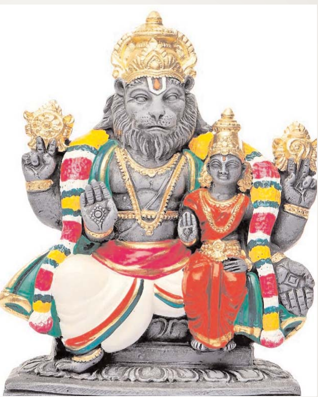
హిరణ్యకశిపుడిని అంతమొందించి, ప్రహ్లాదుడినికాపాడే లక్ష్యంతో ఈ అవతారం ఏర్పడింది.

విష్ణుమూర్తి యొక్క దశావతారాలలోని 4వ అవతారమే నరసింహస్వామి అవతారం. స్వసింహ జయంతి వైశాఖ శుక్ల చతుర్దశి నాడు జరుపుకొంటారు. నరసింహస్వామి రూపంలో దేహం మానవ రూపం, తల సింహం రూపంలో అవతరించిన దేవుడు.స్వసింహస్వామి మహా శక్తి వంతమైన అవతారంగా చూడాలి. ఇదే రోజున విష్ణుమూర్తి హిరణ్యకశిపుడిని సంహరించి, ధర్మాన్ని నిలబెట్టాడు కాబట్టి స్వసింహ జయంతిని వేడుకగా జరుపుకొంటారు. స్వసింహ జయంతి పుణ్యతాంబలం ప్రకారం ప్రహ్లాదుడి కోసం ఆయనజన్మించారు. హిందూ పురాణాల ప్రకారం త్రిమూర్తులలో విష్ణువు లోకపాలకుడు. సాధు పరిరక్షణ కొరకు, దుష్టశిక్షణ కొరకు ఆయన ఎన్నో అవతారాలలో యుగయుగాన అవతరిస్తాడు. అలాంటి అవతారాలలో 21 ముఖ్య అవతారాలను ఏకవింశతీ అవతారములు అంటారు. వానిలో అతి ముఖ్యమైన 10 అవతారాలను దశావతారాలు అంటారు. ఈ దశావతారాలలో నాలుగవ అవతారము నారసింహావతారము. మహాకవి సందోధించే 'శ్రీ' పదాన్ని చేర్చి శ్రీనారసింహాడని ఈ అవతార మూర్తిని స్మరిస్తారు. హిరణ్యకశిపుడిని అంతమొందించి, ప్రహ్లాదుడినికాపాడే లక్ష్యంతో ఈ అవతారం ఏర్పడింది.