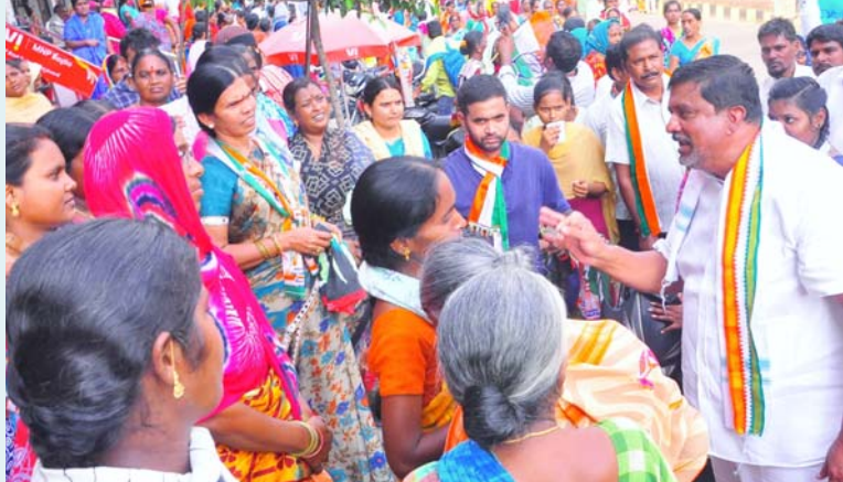
కరీంనగర్ మే 11 (ప్రజా మంటలు) :

వెలిచాల "శక్తి ప్రదర్శన"- 70 వేల మందితో భారీ ప్రదర్శన. గెలుపు ఖాయమని రాజేందర్ రావు వెల్లడి - వెయ్యి మంది కళాకారులతో కాంగ్రెస్ టీవీలో జన సంద్రం