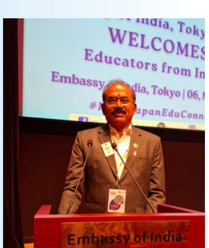
ధర్మపాగర్ మే 11 (ప్రజామంటలు):