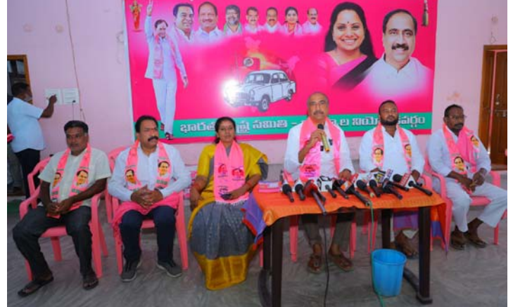
జగిత్యాల జిల్లా ప్రసానిధి మే 11 (ప్రజామంటలు):