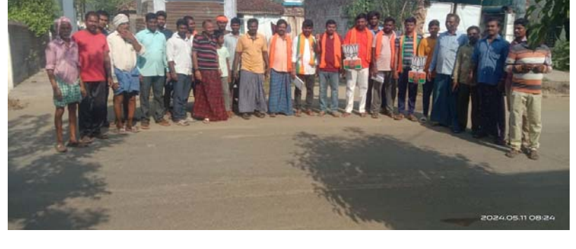
ఇల్లందకుంట మే 11 (ప్రజామంటలు):