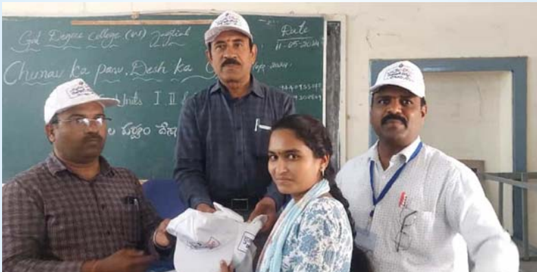
జగిత్యాల మే 11 (ప్రజామంటలు):