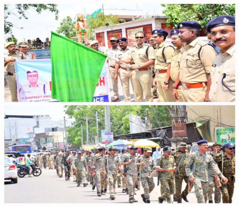
జగిత్యాల మే 11 (ప్రజామంటలు):

శ్రీ. ఫెయిర్ ఎన్నికల కొరకే షాగ్ మార్ట్ అన్ని వర్గాల ప్రజలు పాటించాలి సహకరించాలి శాంతి భద్రతలకు విఘాతం కలిగిస్తే కఠిన చర్యలు : ఎస్సీ సన్ ప్రీత్ సింగ్