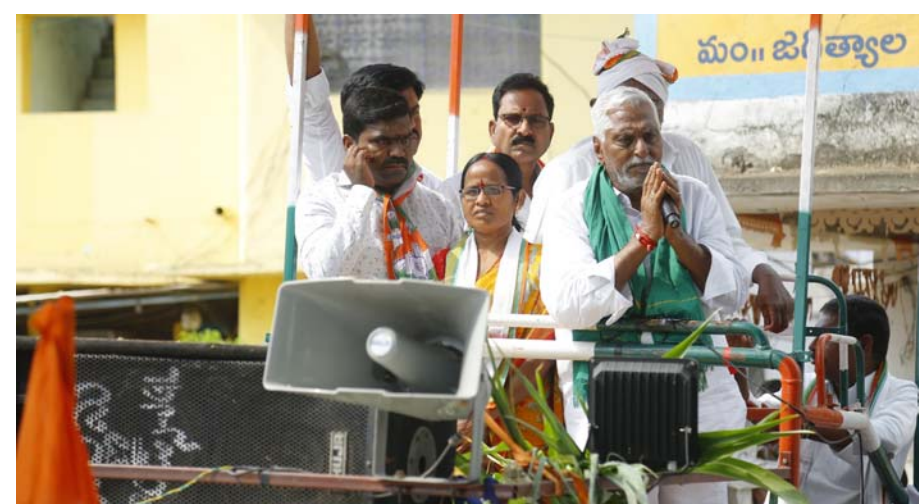
జగిత్యాల జిల్లా ప్రసానిధి మే 10 (ప్రజామంటలు):

జగిత్యాల ప్రజల రుణం తీర్చుకునే అవకాశం ఇవ్వండి