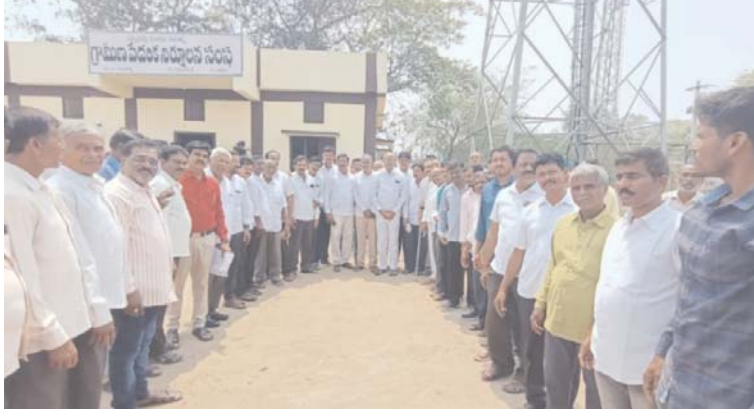
ఈ సందర్భంగా విలేకరుల సమావేశంలో తెలియజేశారు. ఈ కార్యక్రమంలో రాష్ట్ర, జిల్లా, మండల, ఆరె సంఘం నాయకులు పాల్గొన్నారు.