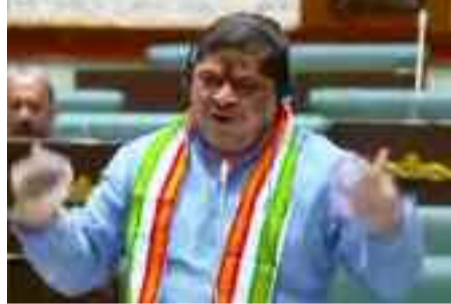
బీసీ వెల్ఫేర్ మినిస్టర్ నిన్ను బిల్లు ప్రవేశపెట్టిన మిగతా 3 లో .

హైదరాబాద్, ఫిబ్రవరి 17 : మేము మాట ఇచ్చాము ఆ మాట ప్రకారం నిర్ణయం తీసుకున్నాం అని బీసీ సంక్షేమ శాఖ మంత్రి పాన్సం ప్రభాకర్ తెలిపారు. కులగణననీ ఏకగ్రీవంగా ఆమోదం తెలిపినందుకు అందరికీ ధన్యవాదాలు.. మేము ఎవరికి వ్యతిరేకం కాదు.. అన్ని పార్టీల అభిప్రాయాలు తీసుకున్నామని ఆయన చెప్పారు. బదుగు బలహీన వర్గాలు సామాజిక, రాజకీయ, ఉద్యోగాల్లో మిగతా 3 లో .