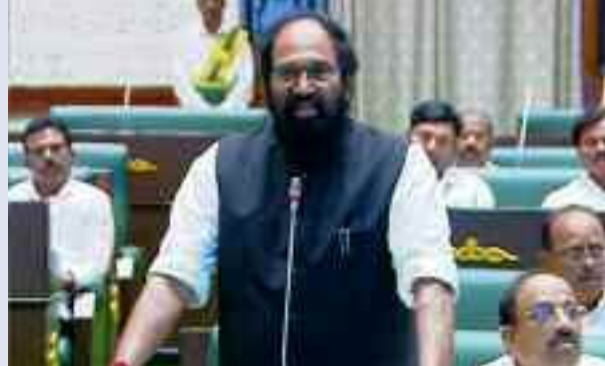
ప్రాజెక్టుల కోసం 84వేల కోట్ల అప్పు తెచ్చారన్నారు మంత్రి ఉత్తమ్. 'గత ప్రభుత్వం చేసిన ప్రతి రూపాయికి వచ్చే ప్రయోజనం 52 పైసలే.. కాంట్రాక్టర్లకు రూ.వేల కోట్లు లబ్ధి చేకూర్చినట్లు కాగ్ నివేదికలో చెప్పిందన్నారు మంత్రి ఉత్తమ్.

నుంచి లీకులు మొదలయ్యాయని ఆరోపించారు మంత్రి ఉత్తమ్. ప్రాజెక్టు నిర్మాణం తర్వాత కనీసం ఇన్స్పెక్షన్ కూడా లేకుండా ప్రారంభించారని మండిపడ్డారు. అన్వారం, మేడిగడ్డ ప్రాజెక్టుల్లో అస్సలు నీరు నింపాల్సిన % బీజూ % రిపోర్టు ఇచ్చినట్లు మంత్రి ఉత్తమ్ చెప్పారు. కాళేశ్వరం, దాని అనుసంధానంగా నిర్మించిన ప్రాజెక్టులో డిజైన్, నిర్మాణంలో లోపం ఉన్నట్లు విజిలెన్స్ రిపోర్టు బయటపెట్టినందున మంత్రి ఉత్తమ్. కాగ్ రిపోర్ట్ ఆధారంగా కఠిన చర్యలు ఉంటాయని హెచ్చరించారు. పాలమూరు - రంగారెడ్డి ప్రాజెక్టు కోసం కోట్ల రూపాయలు ఖర్చు చేసినా.. ఒక్క ఎకరాకు కూడా నీళ్లు ఇవ్వలేకపోయారన్నారు మంత్రి ఉత్తమ్. శ్రీశైలం జలాశయాలు ఏపీకి తరలివేలా అప్పటి సీఎం కేసీఆర్ సహకరించారని ఆరోపించారు. ఆర్డీఎస్పై గత ప్రభుత్వ నిర్ణయం వల్ల అక్కడి రైతులకు సాగునీరు అందడంలేదన్నారు. కృష్ణాజలాలను ఏపీకి తాకట్టు పెట్టి దక్షిణ తెలంగాణకు అన్యాయం చేశారని విమర్శించారు. మిడీ మానేరు, ఎల్లంపల్లి ప్రాజెక్టు నుంచి నీరు ఇచ్చి కాళేశ్వరం అని చెప్పారని వెల్లడించారు మంత్రి ఉత్తమ్. కాళేశ్వరం ప్రాజెక్టు నుంచి ఉపయోగం ఎంతో తెలియదు కానీ.. ప్రతియేటా కరెంట్ బిల్లు మాత్రం 10వేల కోట్లు ఉంటుందన్నారు. గత ప్రభుత్వ హయాంలో ఇరిగేషన్ శాఖ